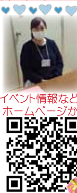
イベント情報などはホームページから

スタッフちゃん 「お付き合い報告を最大限活用 しよつ」解説: ホームページ に報告ページがあるのをご存 じですか? 知らない方はど にチェック? 知らない方はど じやなくて、自分の行動と比 較して! 上手にいく秘訣がそ こには隠されていますよ!